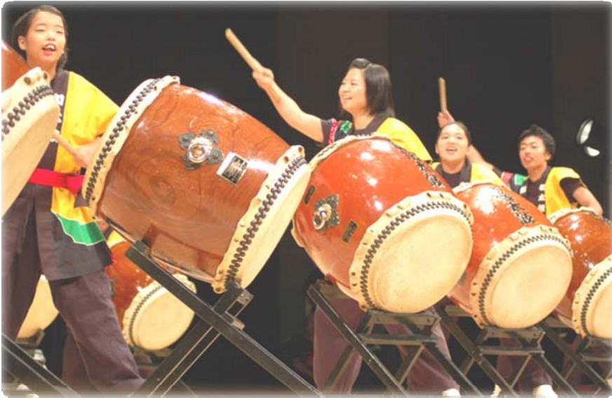
豊里学園“鼓粹”のオープニング（日本太鼓全国障害者大会より）

参加費：千円（素敵な記念品を用意しています） ★参加ご希望の方は、事前に左記へご連絡下さい。 総合社会福祉研究所 TEL 06(6779)4894