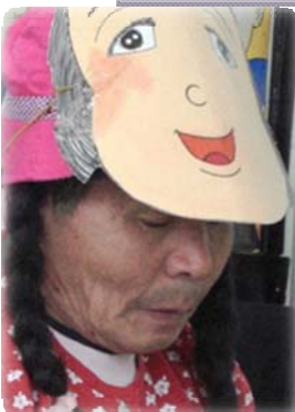
釜が崎の紙芝居“むすび”のみなさん（新作披露）